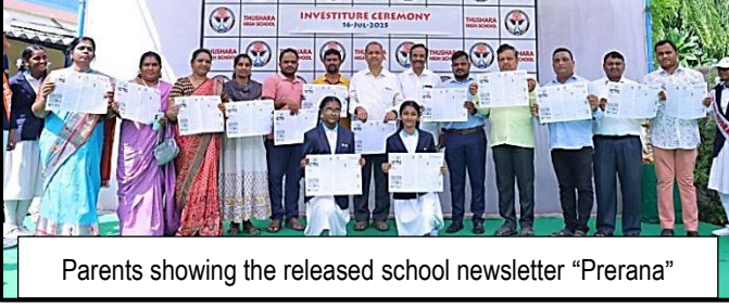
Parents showing the released school newsletter "Prerana"

A moment of immense pride followed—the launch of the school magazine PRERANA—which was unveiled by the Director, Principal, Vice Principal, and proud parents, signifying a collective celebration of student achievements and creativity.